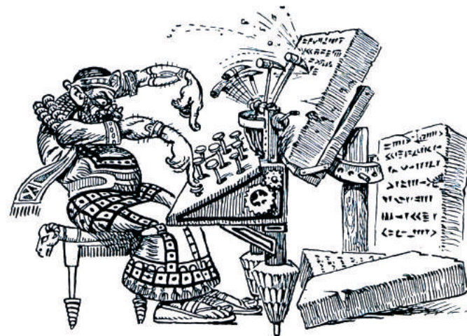
Sehreibmaschine für Keilsehrift.

Heilig-Geist-Kapelle Wirtschaftswissenschaftliche Fakultät der Humboldt-Universität zu Berlin Spandauer Straße 1 - 10178 Berlin