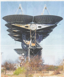
Die Radaranlage bei Jewpatorija auf der Insel Krim: Von hier wurde 1962 die erste Morsebotschaft ins Weltall gesendet.