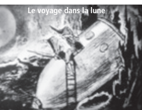
Le voyage dans la lune